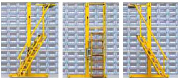
posizione di scala sinistra